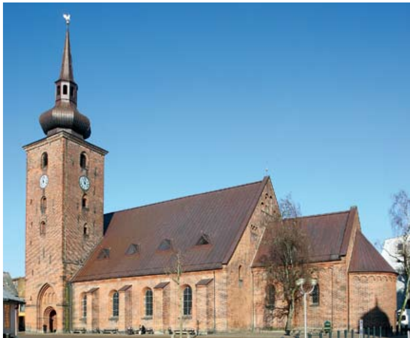
5. Vor Frelsers Kirke er opført af kong Valdemar Sejr omkring 1225 som en romansk treskibet basilika. Den gang var teglsten nye og kostbare. Der var to tårne oprindeligt. Det indre har en af Danmarks smukkeste træskårne prædikestole fra 1670. (26.2.2013)