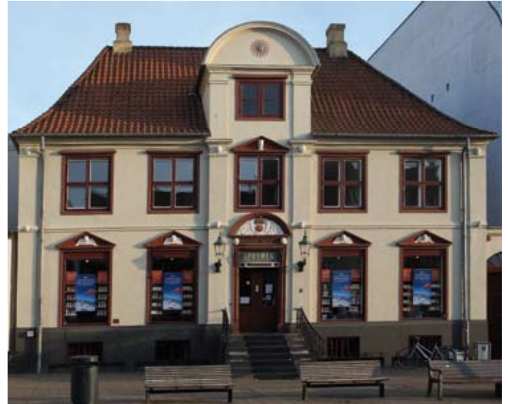
4. Helms Apotek fra 1736 har været apotek lige siden. Det er udsmykket med engle- og andre hoveder, der stammer fra ombygningen af Urup herregård 1809. Der er trappe op til butikken, hvilket var almindeligt i alle huse, for så lå kælderens delvist over gadeniveau og kunne få lys gennem vinduer. Familien Helms ejede apoteket i over 200 år. (7.7.2013).