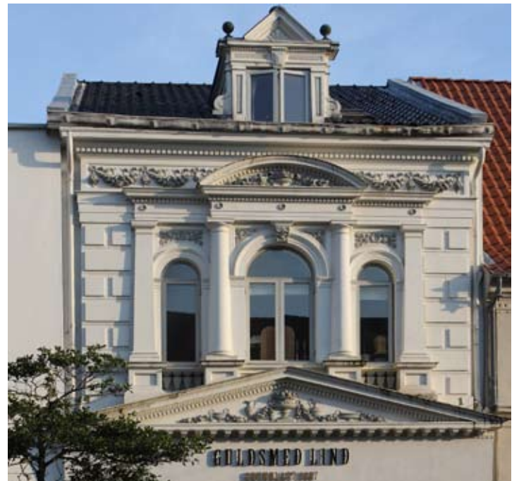
6. Guldsmid Linds bygning. Bygningen opført 1887 i den tids stil. Den trekantede gavl og søjlerne er græsk tempel, men blomsterrankerne er typisk for 1880erne. Symmetrien er perfekt. (7.7.2013).