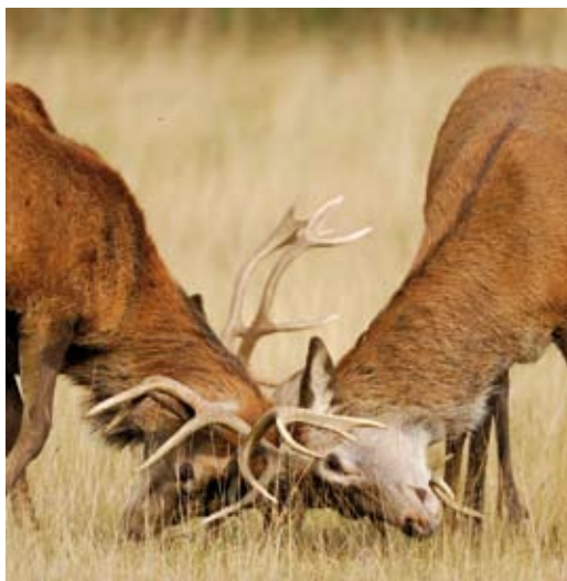
F. To kronhjorte slås. Sommetider kan de ikke komme fri af hinanden, og så må de begge dø af sult.

Kronhjorten er indvandret til Danmark for ca. 10.000 år siden. Der er mange fund af knogler og takker i oldtidens bopladser, for hjorten har altid været vigtig til fremstilling af redskaber.