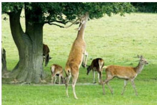
D. Kronhjort æder frisk løv så højt, den kan nå. Hvor der er kronhjorte, kan man se langt gennem skoven. (Clinton Moffat. Dreamstime.com).

1700-tallet blev skaderne på markene så store, at regeringen besluttede, at kronhjordene skulle udryddes, undtagen i dyrehaver. Jægerne skød, hvad de kunne, og i 1854 var alle Sjællands hjorte og i 1872 alle Fyns udryddet. Jyllands hjorte gik tilbage, men nogle godser ville bevare jagten, og fra de dyr stammer Jyllands store hjortebestand. Den voksede langsomt, men da Vestjyllands nåletræsplantager blev store i 1900-tallet, fik hjortene et godt levested. Nu er der også en bestand på Sjælland.