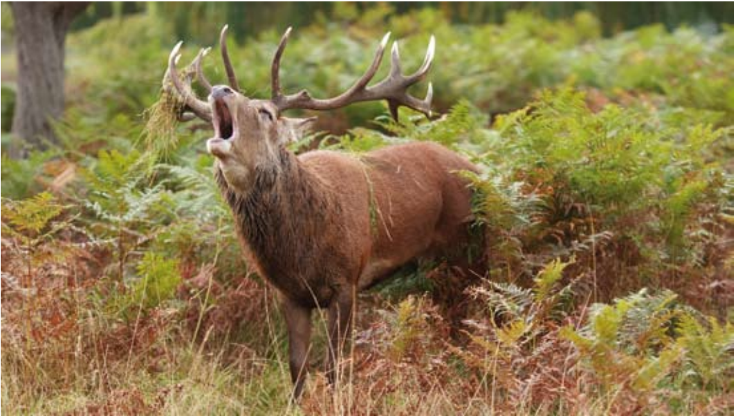
A. Kronhjort hævder territorium ved at brøle højt. Den er ophidset og har slået om sig med geviret, så der er planter på det.