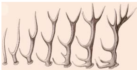
E. Kronhjordtegeviret. Jo ældre de bliver, jo større bliver geviret. Det ender med en krone af takker øverst. (Zoologia Danica. Pattedyr).

Hinden kan kun parres nogle få timer. Så får hannen lov til at bestige hende. Hver parring varer kun