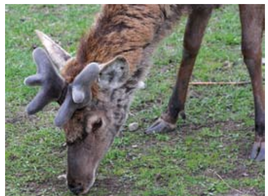
C. Kronhjortens gevir gror. Det er dækket med bast. Klovene ses tydeligt.